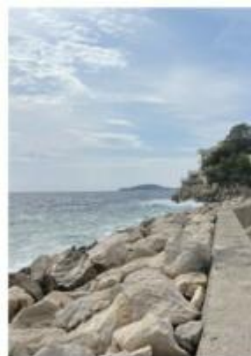
VUE 1 - PROJET